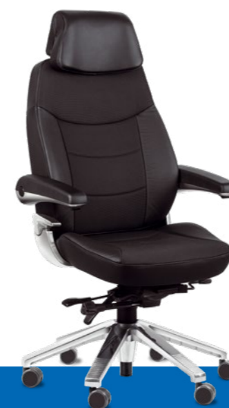
Svenstol ® S5

Selbstverständlich geht es auch beim Svenstol ® S6 vor allem um komfortables Sitzen und entspanntes Arbeiten. Deshalb sind Funktionen und Sitzkomfort wie beim Svenstol ® S5 . Nehmen Sie Platz und erleben Sie ein ganz neues Sitzgefühl. Aber immer daran denken: Überstunden bezahlt Ihnen niemand.