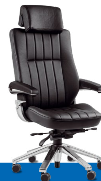
Svenstol ® S6