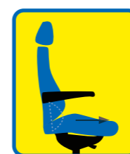
Support de bassin