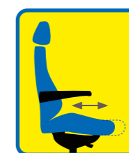
Réglage en profondeur de l'assise