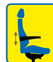
Armleuning met hoogte aanpassing