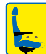
Längdjustering av sitsen